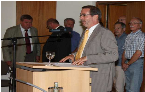
Matthias Platzeck bei seiner Grußrede

Bei der Jahreshauptversammlung des DPV am Samstag 20.6.2009 stattete Matthias Platzeck den Preisrichtern einen Besuch ab. Ministerpräsident Platzeck war auch gleichzeitig der Schirmherr der ZDRK Tagung. Die Heimat von Ministerpräsident Platzeck ist die Uckermark, seine Partei die SPD.