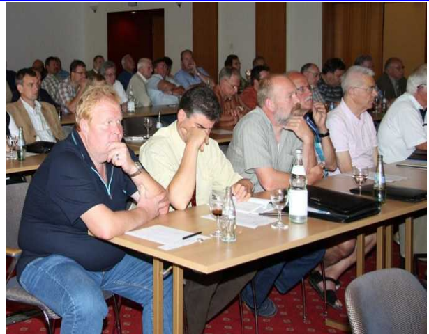
Die Teilnehmer aus dem Landesverband Württemberg und Hohenzollern.